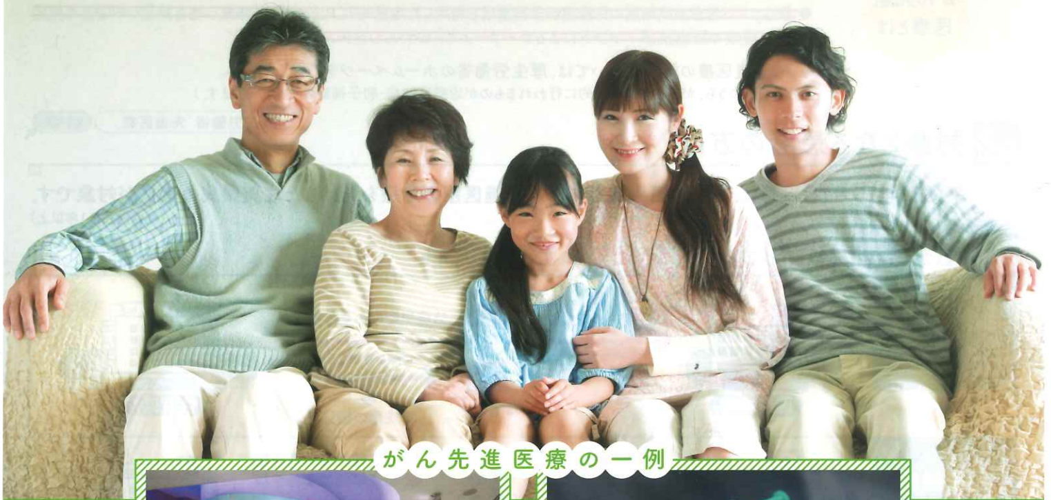
がん先進医療の一例