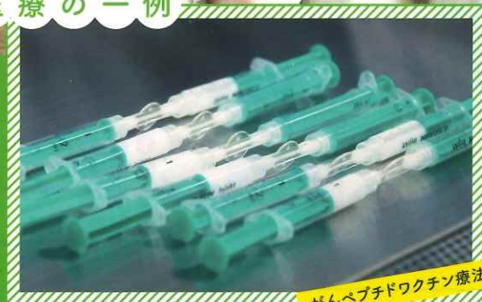
がんペプチドワクチン療法