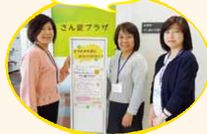
佐賀メディカルセンタービル1F