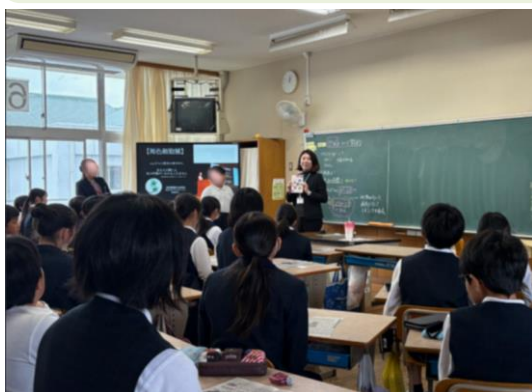
がん撲滅特別対策室 原田係長より、シールについて説明

11月12日（水）三日月小学校6年生の「がん教育」授業にお伺いし、がん検診の啓発活動として作成した「ぼくたち、かくれんぼ好きながん細胞。」のシールをお渡ししました。