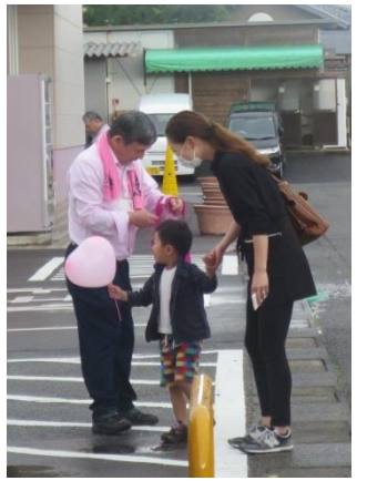
写真は昨年の様子です。